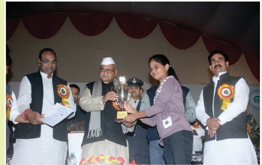
महामहिम राज्यपाल श्री रामनरेश यादव के मुख्य आतिथ्य में अंतर्राष्ट्रीय हर्बल मेला का समापन समारोह भोपाल में आयोजित किया गया। (26 नवम्बर 2012)