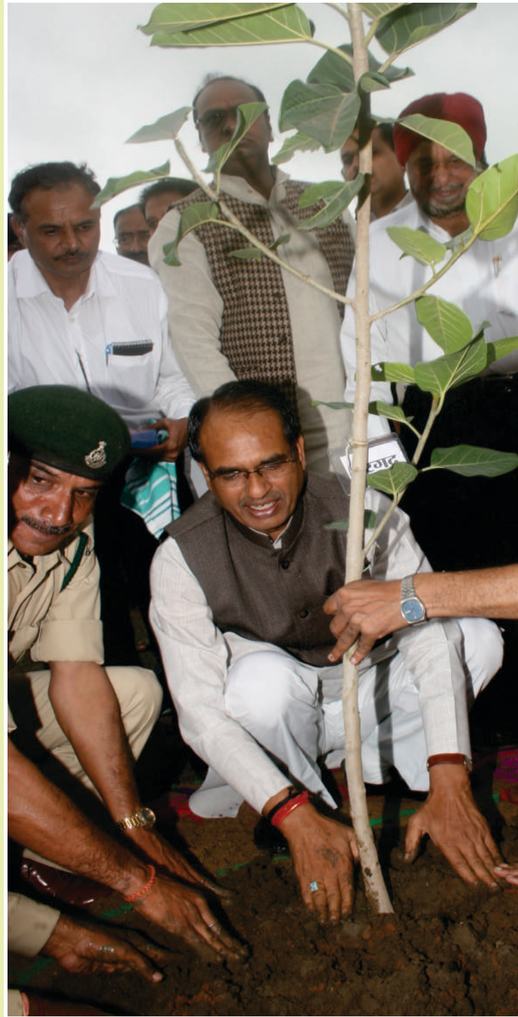
माननीय मुख्यमंत्री श्री शिवराज सिंह चौहान वन महोत्सव कार्यक्रम में बरगद का पौधारोपण करते हुए। (14 अगस्त 2012)