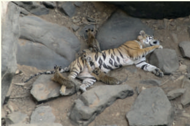
पुनर्स्थापित बाघिन द्वारा पन्ना में प्रजनन

ins'k ea lFkr iUuk ck?k fjtoZ ea ck?k iztkfr dks i qLFkfi r djus ds fu.kZ dsrgr vHk rd 4 ck?kua, oa 1 ck?k dh i qLFkfi uk dh x; h gA iUuk VkbZj fjtoZej orZku ea 4 v)Z o; Ld uj ck?k 1 v)Z o; Ld eknk ck?ku , oa 8 'kkodka l fgr dty 18 ck?k&ck?ku fo | eku gA