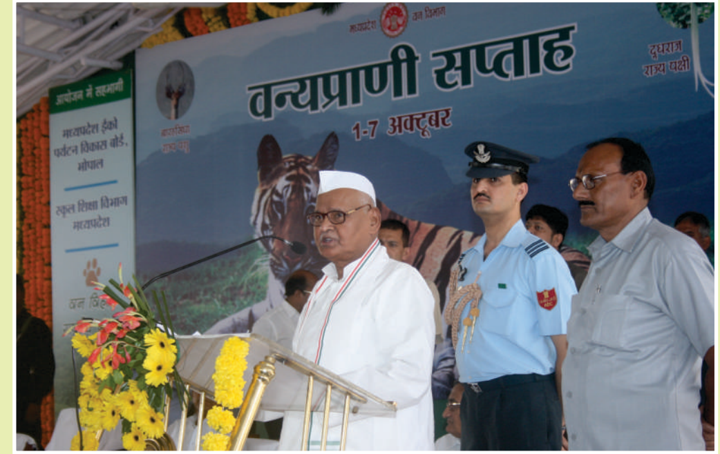
महामहिम राज्यपाल श्री रामनरेश यादव के मुख्य आतिथ्य में राज्य स्तरीय वन्यप्राणी संरक्षण सप्ताह का समापन समारोह भोपाल में आयोजित किया गया। (7 अक्टूबर 2012)