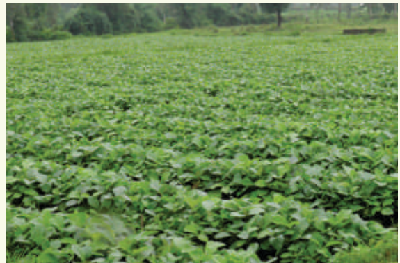
सागौन रोपणी। रामपुर भतोड़ी, बैतूल

Jfed dY; k.kdkjh ; k efgykvkadsfy; si Fkd I sldkbZ ; kst uk fuxe }kjk ugha pykbZ tk jgh g& i jarqfuxe }kjk I pkfyr I eLr okfudh dk; Zfcuk HknHkko dsefgyk , oai q "k Jfedka }kjk gh I ilu fd; s tkrs g& fuxe dk vf/kdkak dk; Zks= vkfnokl h cgyy g& fuxe dh LFkkbZ jki f.k; ka ea o"Kz Hkj yxkrkj dk; Zmi yC/k jgrk g& ftl ea vf/kdkak efgyk, a dk; jr g& fuxe ds vU; okfudh dk; ka ea Hkh efgykvka dks jkst xkj ds cjkcj vol j inku fd; s tkrs g& bu dk; ka ea i fro"KzyxHkx 40 yk[k ekuo fnol jkst xkj mi yC/k dj; k tkrk g&