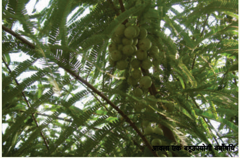
आवला एक बहुउपयोगी वनोपधि

24. LFkkuh; tul epk; dh I fØ; Hkxhnhkj }kj k ikdfrd ouksea0; kol kf; d , oavkSk/kh; egRo dh iztkfr; ka dh I rr-fonsgu rduhd dk fu/kkj .k , oafodkl A