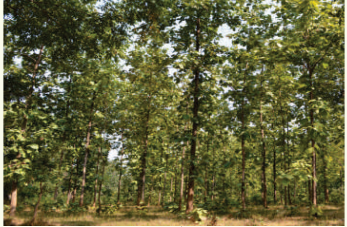
सागौन रोपण। मोहगांव परियोजना, मण्डला

xBu ds l e; fuxe dh vf/kdr vaki n t h # i ; s 20 d j k M + F k h A 31 v D V m j 2006 l s fuxe dh vf/kdr vaki n t h : i ; s 40-00 d j k M + r F k k i n R r vaki n t h : i ; s 39 [ 31 ] 75 ] 600 g A f t l e a l s d b n z ' k k l u d k v a k n k u : i ; s 1 ] 38 ] 60 ] 000 , o a e / ; i n s k ' k k l u d k v a k n k u : i ; s 37 ] 93 ] 15 ] 600 g A