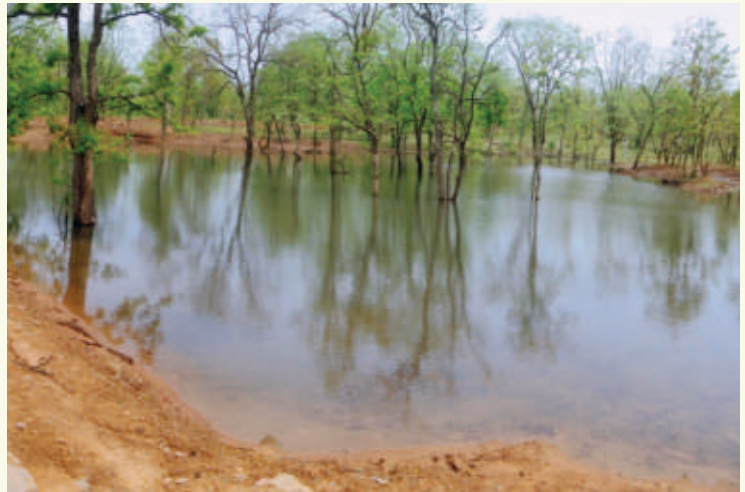
माईक्रोवाटर शेड बहेरिया, तेन्दूखेड़ा