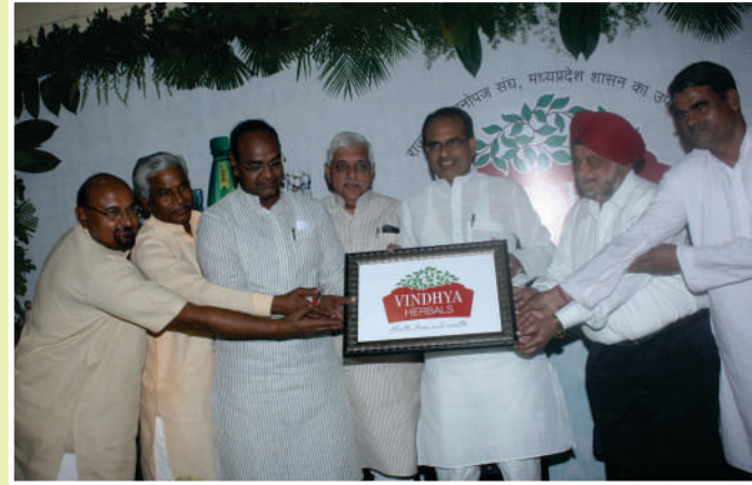
माननीय मुख्यमंत्री श्री शिवराज सिंह चौहान विन्ध्य हर्बल एवं सांची के नये उत्पादों की श्रृंखला का लोकार्पण करते हुए। (9 अक्टूबर 2012)