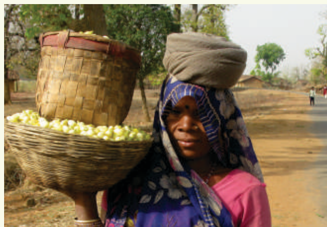
तेन्दूपत्ता एवं महुआ संग्रहण

(ii) सालबीज :- l ky oukaeackjj izkzi dsifji$; eal ky cht l xg.k ij e-iz 'kkl u }kjk in$ k ea2007 l s i wkzi frcdk yxk; k x; k FkkA 2008 l sin$ k eal kycht l xg.k ij yxk ifrcdk gVusdsmijka l kycht l xg.k